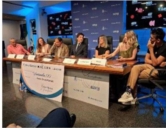
La presentazione delle due serate finali ieri in Regione

Il direttore artistico spiega che «dietro Musicultura c'è un grande patrimonio di valori»