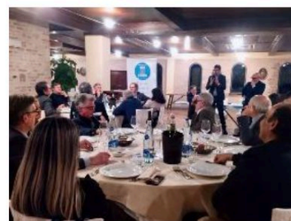
Un momento della serata della Camera penale